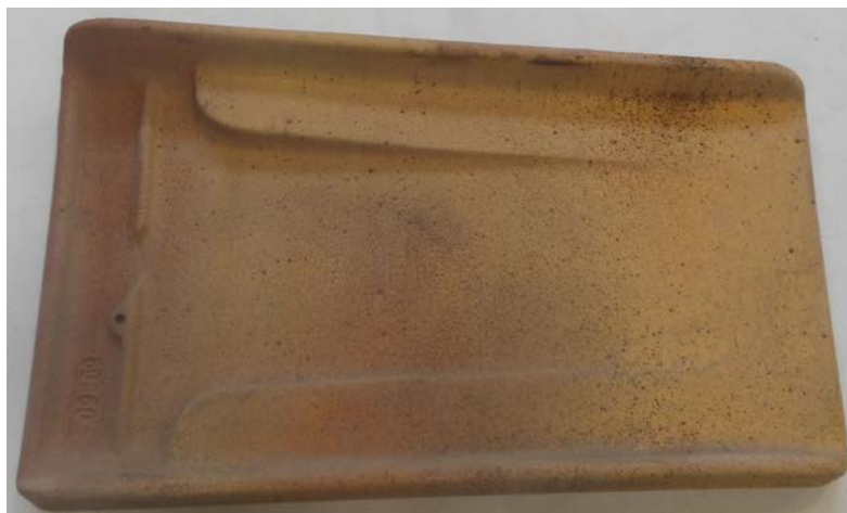
Figura 1. Riproduzione fotografica di un campione tal quale del prodotto "Tegola Invecchiata Chiara".

In Figura 1 viene riportata la fotografia di un campione tal quale rappresentativo del prodotto testato: da 6 tegole tal quali sono stati ottenuti, per taglio ad umido, 6 provini di dimensioni 5 x 5 cm e 2 provini di dimensioni 10 x 10 cm (Figura 2), sui quali sono state effettuate le determinazioni sperimentali oggetto del presente rapporto, così come indicato nella norma di Rif. 2-c.