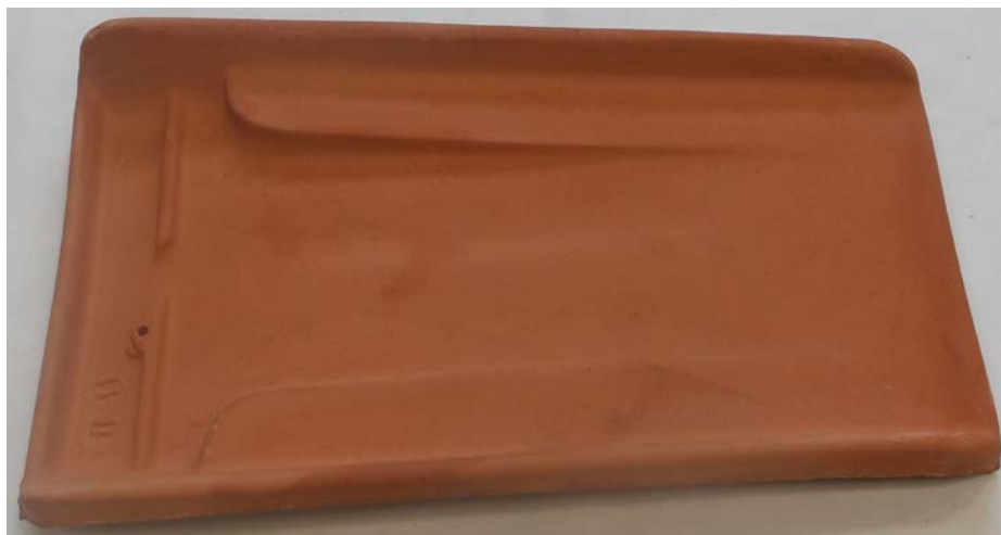
Figura 1. Riproduzione fotografica di un campione tal quale del prodotto "Tegola Rosso Naturale".

In Figura 1 viene riportata la fotografia di un campione tal quale rappresentativo del prodotto testato: da 6 tegole tal quali sono stati ottenuti, per taglio ad umido, 6 provini di dimensioni 5 x 5 cm e 2 provini di dimensioni 10 x 10 cm (Figura 2), sui quali sono state effettuate le determinazioni sperimentali oggetto del presente rapporto, così come indicato nella norma di Rif. 2-c.