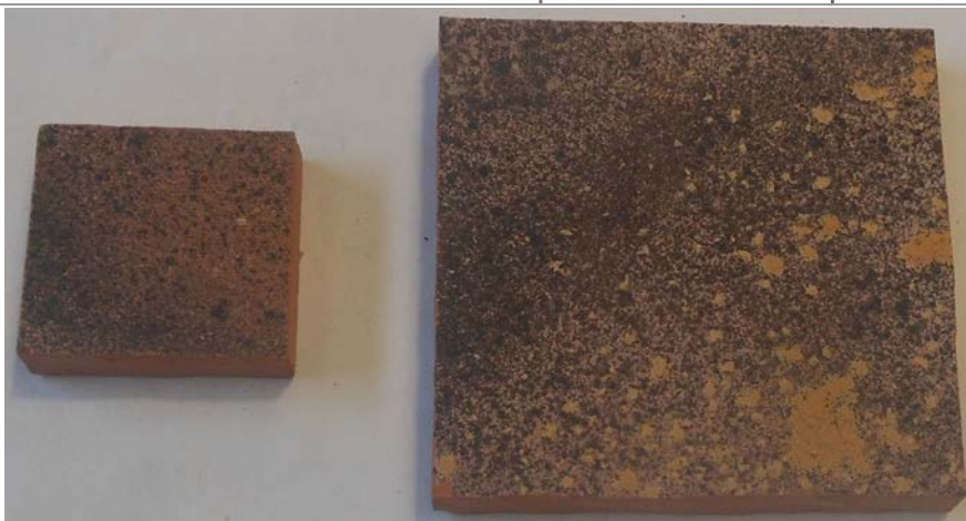
Figura 2. Riproduzione fotografica di provini di dimensioni 5 x 5 cm e 10 x 10 cm ricavati per taglio da una tegola tal quale del prodotto “ Tegola Invecchiata Scura ”. Su tali provini sono state effettuate le determinazioni sperimentali oggetto del presente rapporto.