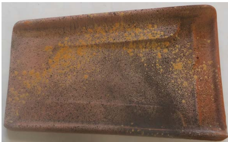
Figura 1. Riproduzione fotografica di un campione tal quale del prodotto "Tegola Invecchiata Scura".

In Figura 1 viene riportata la fotografia di un campione tal quale rappresentativo del prodotto testato: da 6 tegole tal quali sono stati ottenuti, per taglio ad umido, 6 provini di dimensioni 5 x 5 cm e 2 provini di dimensioni 10 x 10 cm (Figura 2), sui quali sono state effettuate le determinazioni sperimentali oggetto del presente rapporto, così come indicato nella norma di Rif. 2-c.