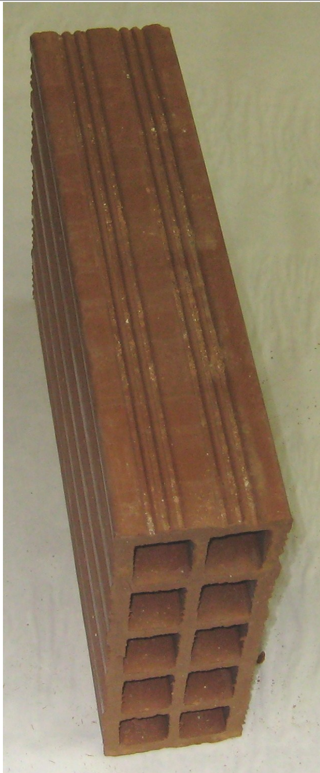
Figura 1. Riproduzione fotografica di un provino tal quale del prodotto "Forato 8x24x33".